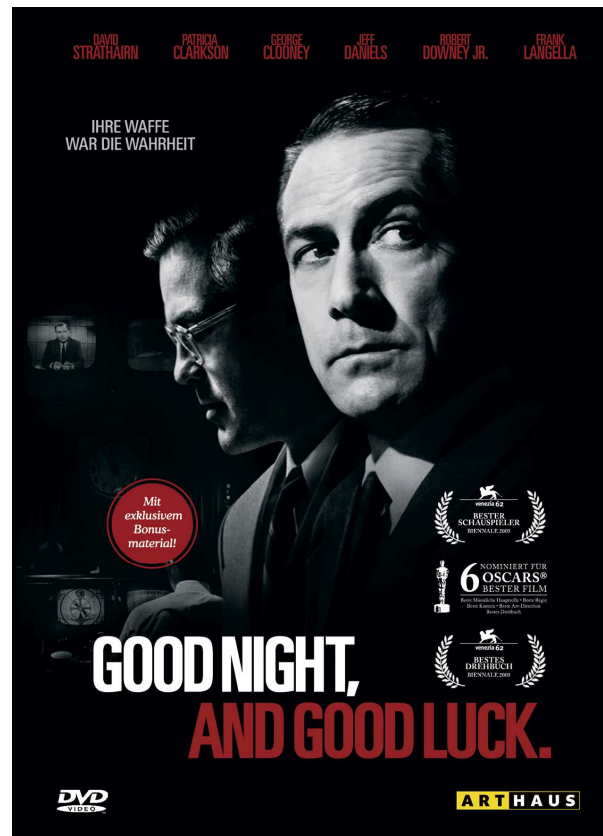
Figura 02 – Cartaz de Boa Noite e Boa Sorte direção de arte e realização em fotografia. No Festival de Veneza recebeu os prêmios Pasinetti de melhor filme, Volpi Cup de melhor ator – mais uma vez para David Strathairn – e o de melhor roteiro.

Conforme mencionado algumas vezes, Boa Noite e Boa Sorte é o filme que tenta retratar o embate ocorrido nos anos 50, nos Estados Unidos, entre o âncora de TV e jornalista, Edward R. Murrow, e o senador de Wisconsin, Joseph McCarthy. A obra, do gênero drama, foi lançada em 2005 e bem aceita pela crítica de arte, recebendo indicações e prêmios. Ao Globo de Ouro, por exemplo, foi indicada a quatro categorias: melhor filme, melhor diretor, melhor roteiro e melhor ator para David Strathairn. Ao Oscar, recebeu seis indicações – melhor diretor, ator em papel principal, roteiro, realização em