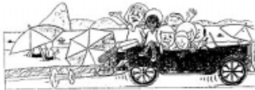
Um passeio de carro

Diferença nas cores existentes apontadas pelas crianças de que um pedaço de bolo