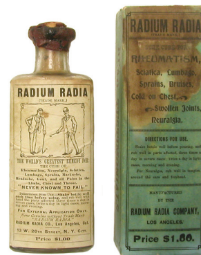
Figura 5: “Radium Radia” (1905), água contendo radioatividade adicionada. Contudo, tratava-se de uma fraude. Reproduzido sob permissão de Oak Ridge Associated Universities, copyright ©1998

Nos anos 1920, era comum a oferta de produtos com níveis de radioatividade maiores do que aqueles vendidos legalmente sob o argumento de que teriam um efeito mais rápido sobre o usuário (Cramp, 1936). Isso era o caso de tônicos como o Radithor . Os fabricantes desses produtos estavam sujeitos a receber doses elevadas de radiação (Harvie, 1999).