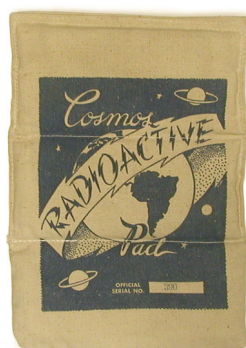
Figura 3: Compressa radioativa “Cosmos Radioactive Pad” (1928).

Tônicos e revigorantes destinavam-se a manter ou recuperar os vigosres