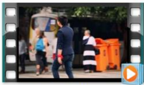
1. Preconceito e Intolerância