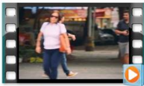
2. Busca com segurança