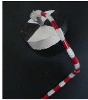
Figura 1. Mini disco de Secchi.

A água utilizada para a análise durante a apresentação foi coletada na própria escola e acondicionada nos dois aquários feitos de garrafa de refrigerante. Em um deles foi adicionada uma colher de sopa de terra, para deixar a água escura. Cada apresentação durava em média uma hora e quarenta minutos. Como atividade inicial, os alunos respondiam ao primeiro questionário. Após a entrega de todos os questionários, os alunos foram levados a refletir sobre a semelhança ou diferença entre os aquários e as respostas foram anotadas no quadro e lá mantidas. A maior parte das respostas concentrou-se na relação água suja e água limpa. Os alunos foram confrontados com a questão muito comum de considerar a água transparente como sinônimo de limpa. Seria isso verdadeiro? A partir daí, a explicação sobre cada um dos parâmetros de análise de água que compõem o Índice de Qualidade das Águas 1 e a experimentação tiveram início. Os primeiros parâmetros explicados foram Nitrogênio total e Fósforo total, uma vez que as reações demoravam para acontecer. Enquanto as reações ocorriam, os outros parâmetros (Turbidez, pH, Oxigênio dissolvido, Demanda Bioquímica de Oxigênio, Coliformes e Sólidos totais) foram explicados. A determinação de pH com as fitas indicadoras e a Turbidez com o disco de Secchi contaram com a participação dos alunos. Importante ressaltar que os alunos não manusearam os reagentes devido à toxicidade dos mesmos.