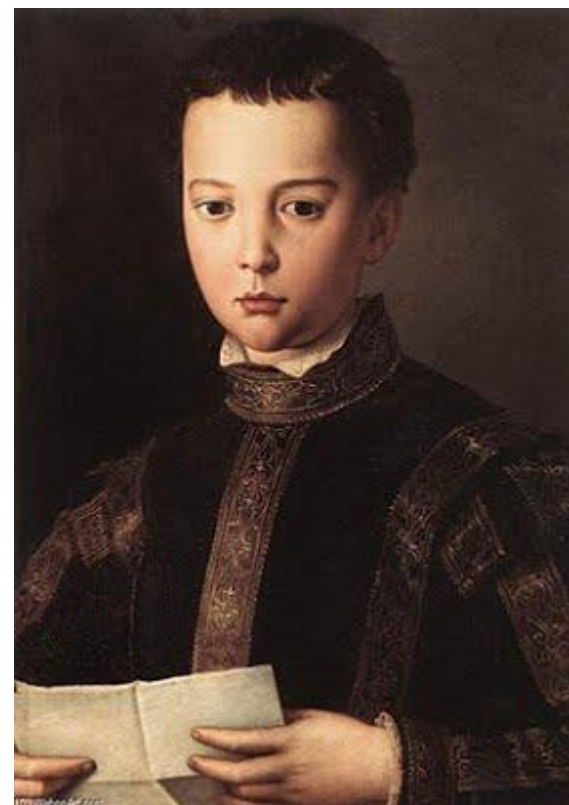
Retrato de Francesco I de Médici (1551), por Agnolo Bronzino https://pt.wahooart.com/@/8Y3UP6-Agnolo-Bronzino-Retrato-de-Francesco-de-Medici

Durante o século XV, o retrato tornou-se um dos gêneros mais importantes da pintura. No Renascimento Italiano, a produção expandiu-se de modo antropocentrista. A burguesia e seus(suas) mecenas utilizaram a arte como símbolo de ascensão e o retrato foi bastante difundido por essa classe. Caravaggio, no entanto, no século XVII, com seu realismo barroco, subverte as normas de representação ao pintar retratos de pessoas do povo.