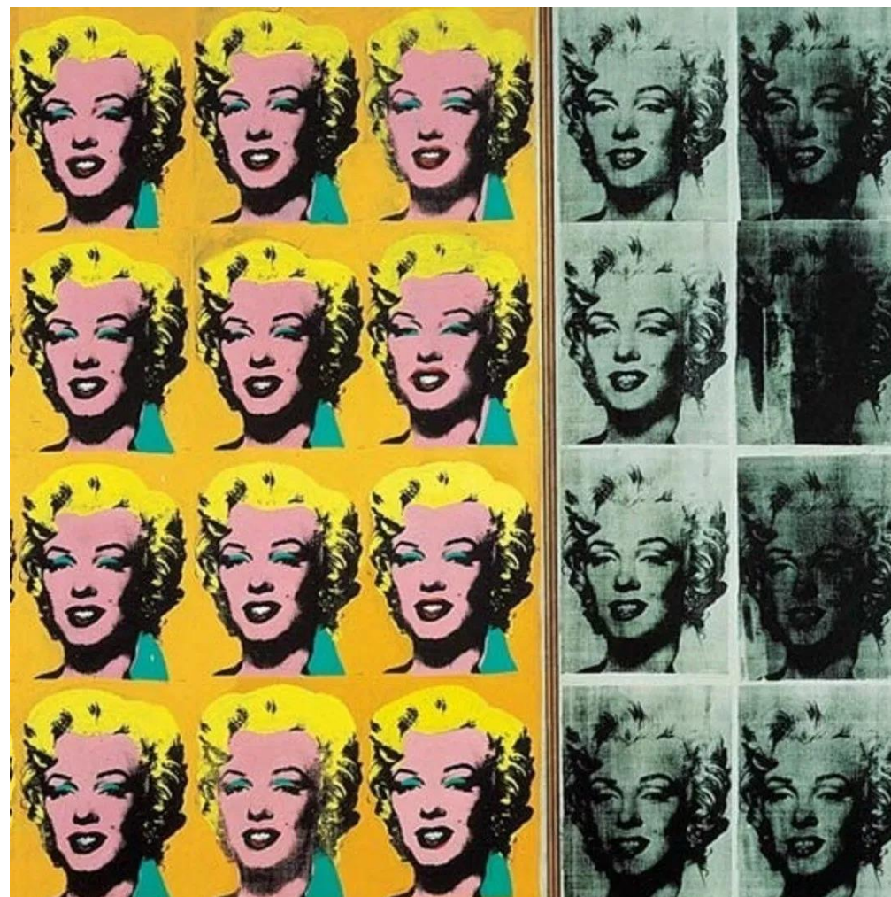
Marilyn Diptych, 1962 por Andy Warhol https://www.tate.org.uk/art/artworks/warhol-marilyn-diptych-t03093