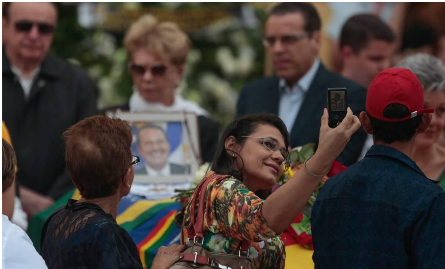
Selfie tirada no velório do Político Eduardo Campos