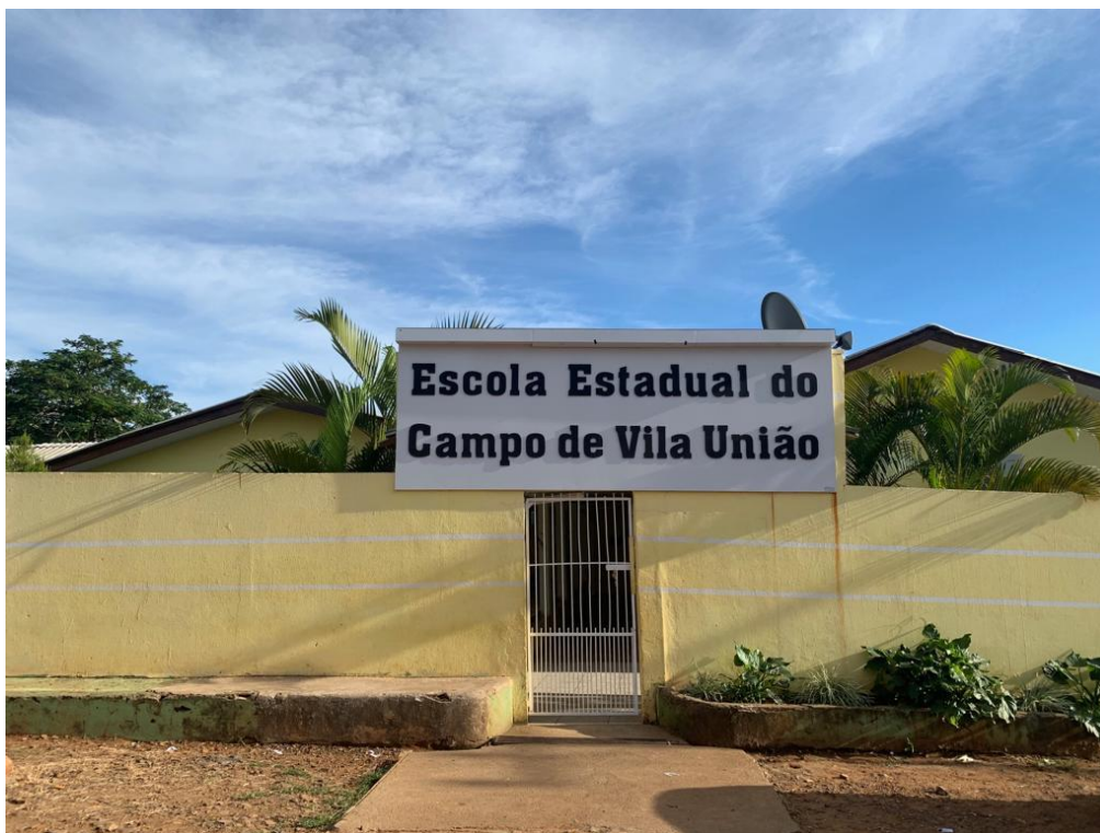
Escola Estadual do Campo de Vila União