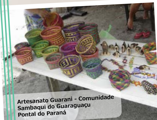
Artesanato Guarani - Comunidade Sambaqui do Guaraguauçu Pontal do Paraná