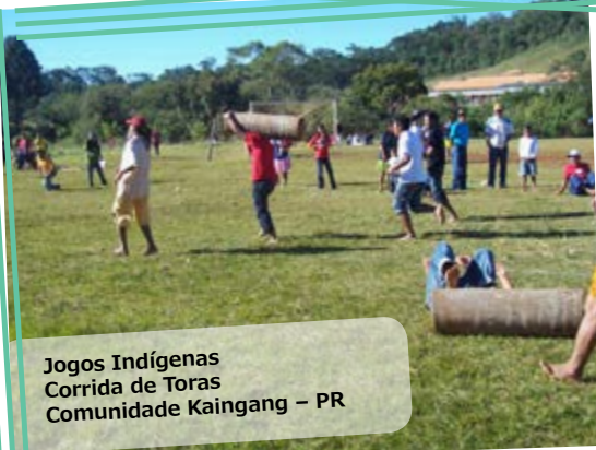
Jogos Indígenas Corrida de Toras Comunidade Kaingang – PR