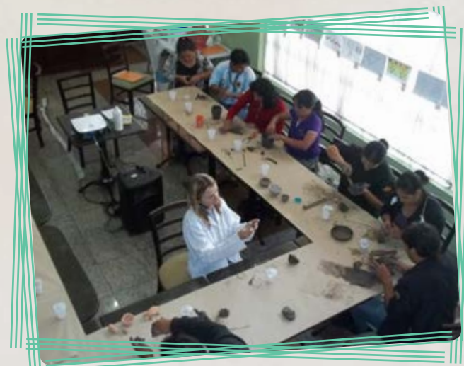
Trabalho em argila - realizado no "Curso de Formação para Professores Indígenas do PR"