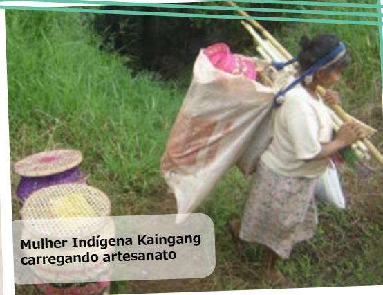
Mulher Indígena Kaingang carregando artesanato