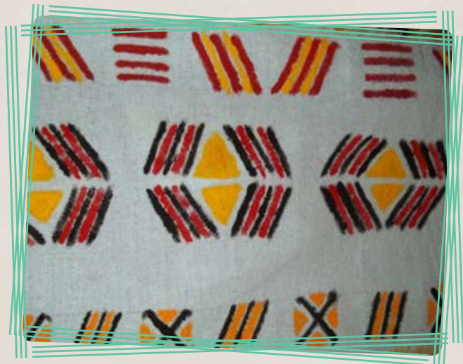
Grafismo Guarani - trabalho realizado no "Curso de Formação para Professores Indígenas do PR"