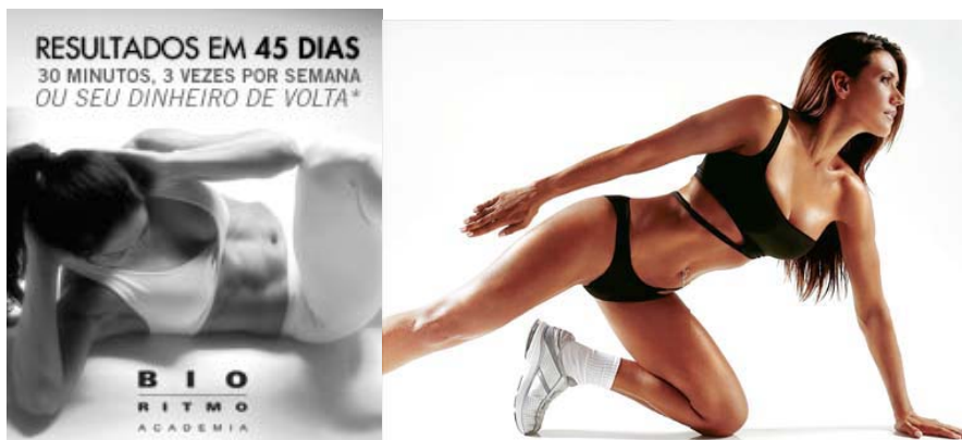
Propaganda da academia Bio Ritmo , www.bioritimo.com.br , 10/06/2007,22:00h.

2) O site www.listas.cev.org.br , janeiro/2005, 21:00h, cita o seguinte: