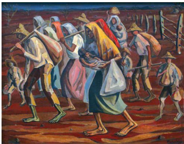
Figura 7: Candido Portinari, Os Retirantes, Óleo sobre tela, 1958.