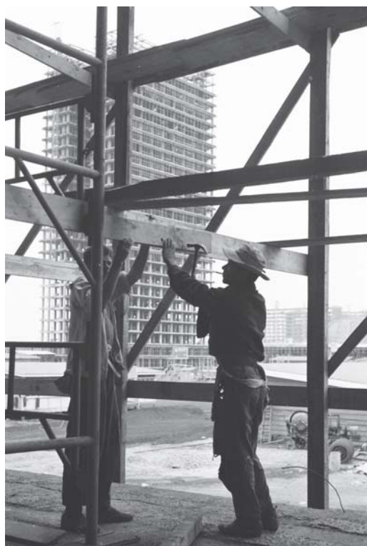
Figura 11: Mario Fontenelle, Construção do Congresso Nacional; Brasília: 10/11/1959.