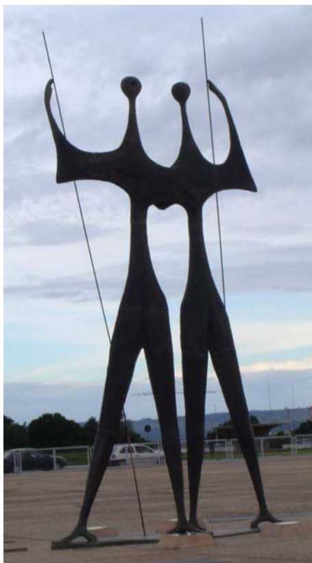
Figura 1: Bruno Giorgi, Os Guerreiros/Os Candangos , bronze, 1957.

colocada na Praça dos Três Poderes em Brasília – antes da inauguração da cidade – com o seu nome original, “Os Guerreiros”. Ali, logo depois, foi renomeada “Os Candangos”.