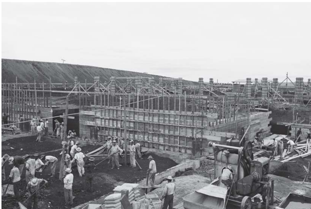
Figura 12: Mario Fontenelle, Construção do Congresso Nacional; Brasília: 31/05/1958.

a pretensão de aludir aos murais cariocas de Portinari, talvez houvesse a intenção de exaltar a beleza do trabalho. Mas, olhando as fotos, surge a pergunta: o quanto os retratados colaboraram com os fotógrafos?