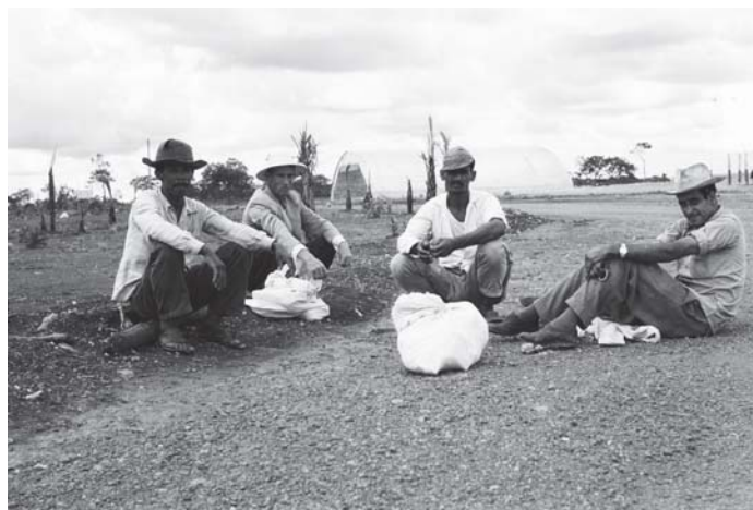
Figura 8: Mario Fontenelle, Retirantes chegando a Brasília: 22/03/1958.

grande seca e, como resultado, se “abateram” sobre o Planalto milhares de trabalhadores itinerantes pobres e sem profissão (cinco mil, apenas no mês de maio) 28 , a maioria procedente do Nordeste. Para abrigá-los foi criada às pressas a cidade satélite de Taguatinga 29 .