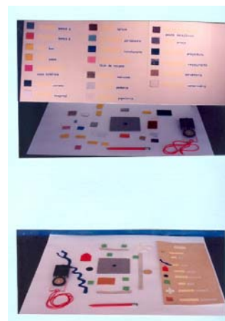
Figura 2 - Exemplos de Materiais do Programa de Iniciação Cartográfica