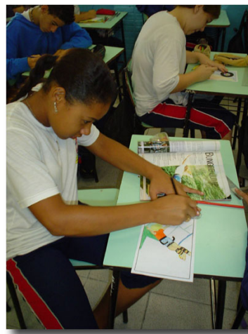
Figura 4 – Professores e alunos de escola pública de S.José dos Campos, em atividades de formação continuada e desenvolvimento de projetos.