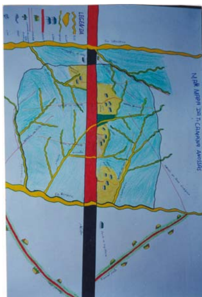
Figura 3 - Mapas elaborados pelos professores indígenas durante aulas de Geografia no Centro de formação dos Povos da Floresta – CPI-Acre