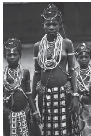
Figura 2. Crianças.

Um mercado negro clandestino foi criado e com ele o tráfico de objetos africanos começou a existir, sem poupar os templos dos deuses, levando o que foi deixado para trás pelos padres, missionários e antropólogos. Se no período da escravidão o tráfico separou homens, atualmente o tráfico de arte africana tira dos homens as imagens de seus deuses e, novamente, o povo africano vê-se corrompido pelo tráfico, quando é levado a entregar aos mercadores os objetos tão desejados.