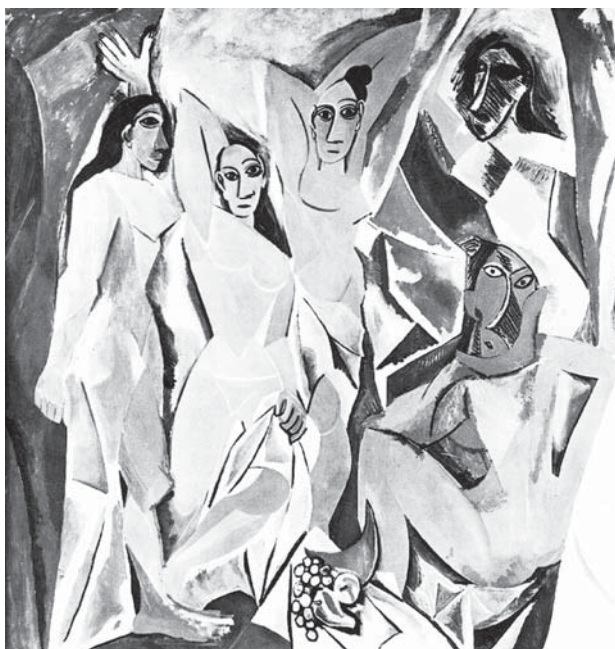
Figura 4. “As donzelas de Avignon”, 1970. Caras , Enciclopédia Multimídia da Arte Universal.

Uma imagem sígnica, rostos talhados que lembram mulheres, corpos nus, um erotismo velado numa ruptura criada pelo desejo de extravasar a criatividade e pelo desafio do artista de superar e quebrar regras estabelecidas. Os seios cortados, formando ângulos e raios ao mesmo tempo, vulvas que não aparecem, nádegas que descansam no espaço vazio preenchido pela tinta. O elemento cor sustenta as formas sugeridas pelo artista e é permitido aos olhos do espectador transformar-se em uma só mão para acomodar tamanha bun-