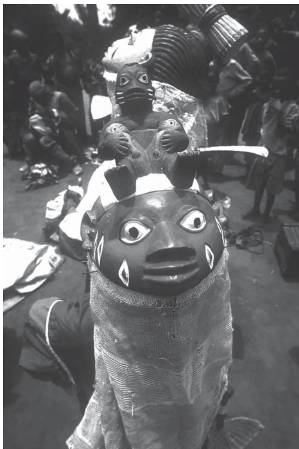
Figura 1. "Geledê".