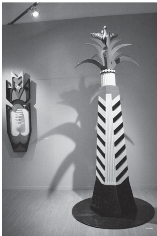
Figura 7. Sala do artista Ronaldo Rego; instalação “Árvore da memória” – FAN, 2º Festival de Arte Negra de Belo Horizonte – 2003.