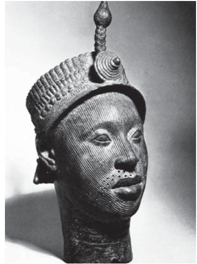
Figura 3. "Cabeça de Olokun" – Benin. Caras , Enciclopédia Multimídia da Arte Universal.

O interesse essencial da arte africana, mesmo que seja da forma plástica, é uma matéria preciosa. Essa forma é sempre poderosa, muito sonhada nas concepções, e portanto apta a nascer nas inspirações dos artistas. Não se trata da rivalidade com os modelos da Antigüidade Clássica, trata-se de renovar os espíritos e formas que levam à observação artística aos mesmos princípios da grande arte. (APOLLINAIRE, 1918)