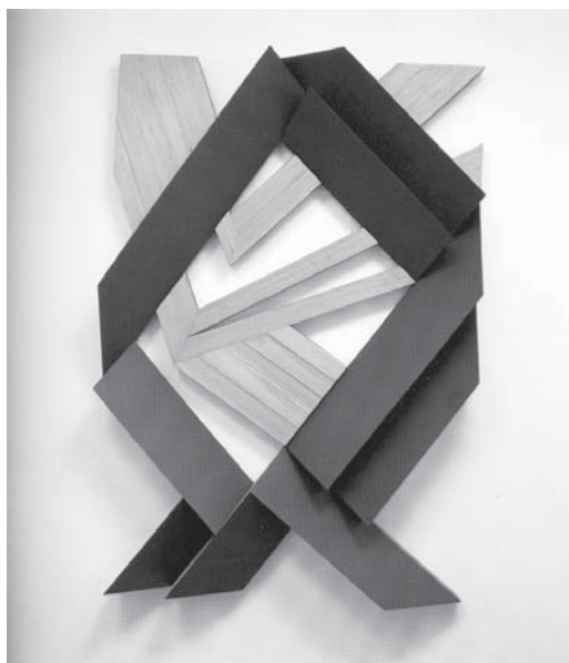
Figura 6. “Oratório”, 1996 – Emanuel Araujo. Catálogo da exposição “Esculturas e relevos”, 1996. Galeria Nara Roesler.

Rubem Valentim, que não é de origem negra, buscou no oxé de Xangô e em toda a iconografia da liturgia nagô formas que foram apropriadas e transformadas em obras concretas/construtivas com obsessiva referência à religião. Cada obra é um resgate preciso, uma carta iconográfica guardada na memória visual. Signos geométricos que representam a ancestralidade. O painel “Emblemático”, que está no Itamaraty em Brasília, é uma homenagem a Oxa-